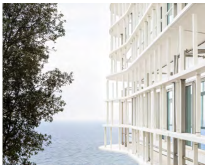
Photos non libres de droits / demande auprès du service Communication AIA Life Designers obligatoire.