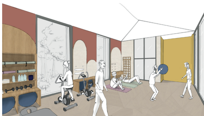
▲ Croquis salle de mise en forme