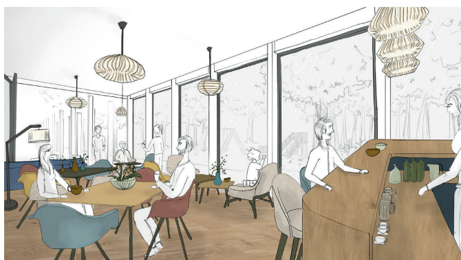
▲ Croquis salon