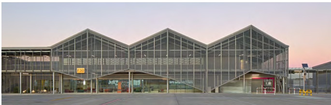
▲ Façade des maisonnées.