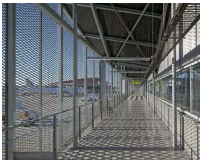
▲ Détail de la structure métallique et de son bardage double peau.