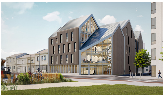
Vue sur l'entrée.