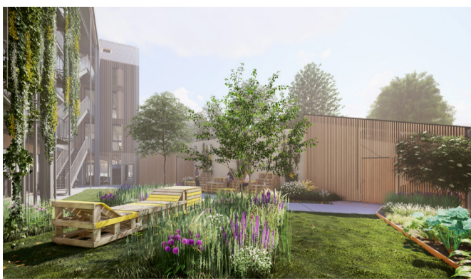
Le jardin partagé.