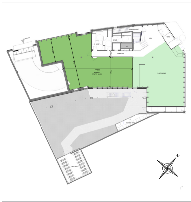
Plan niveau 0.