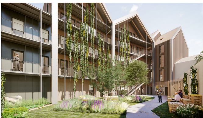
Vue du jardin intérieur.