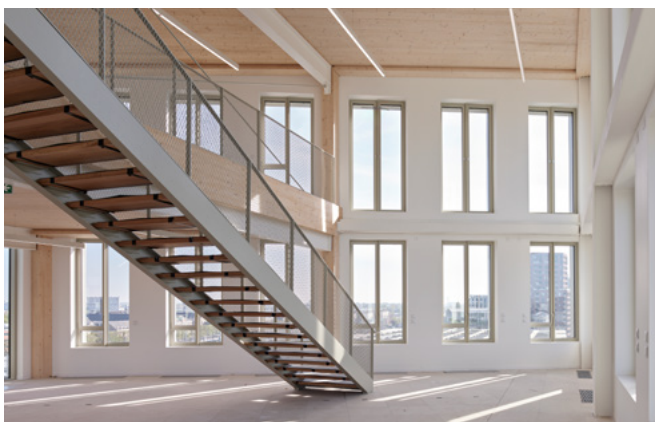
▲ Espace bureaux en mezzanine.