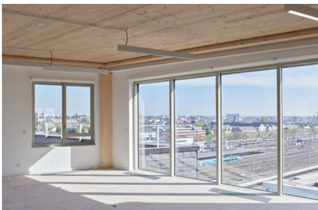
▲ Espace bureaux.