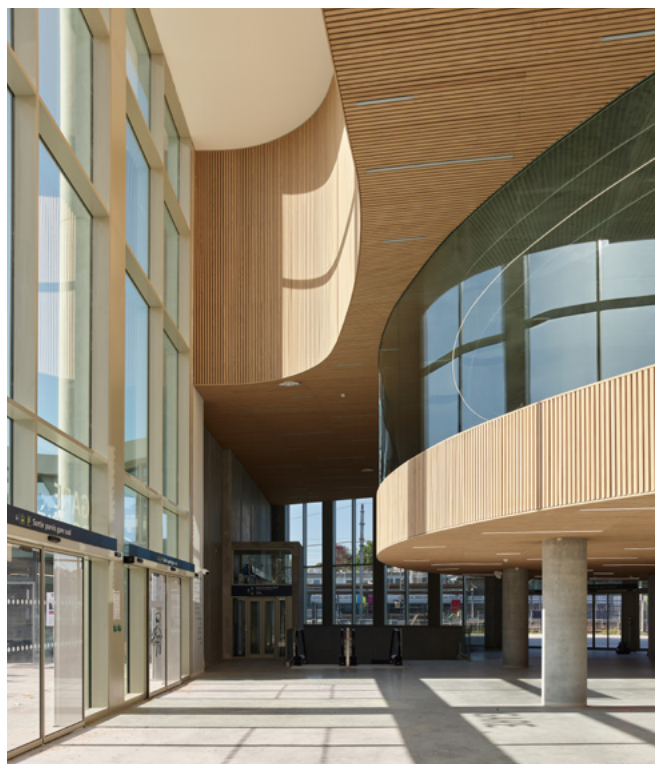
▲ Hall gare routière.

Service presse et communication presse@aialifedesigners.fr - 01 53 68 93 00 © AIA Life Designers et DREAM, architectes - photos : Stéphane Chalmeau